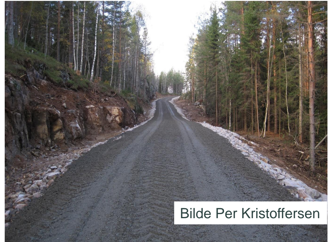
Bilde Per Kristoffersen