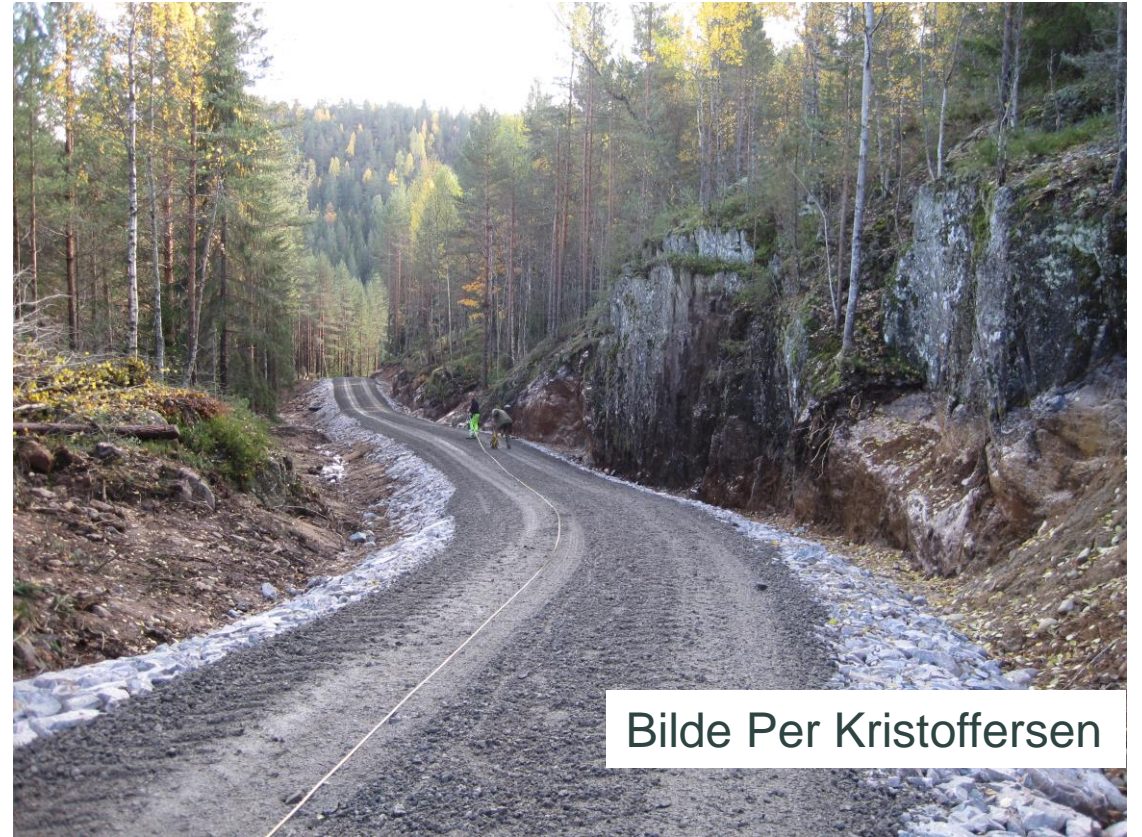
Bilde Per Kristoffersen