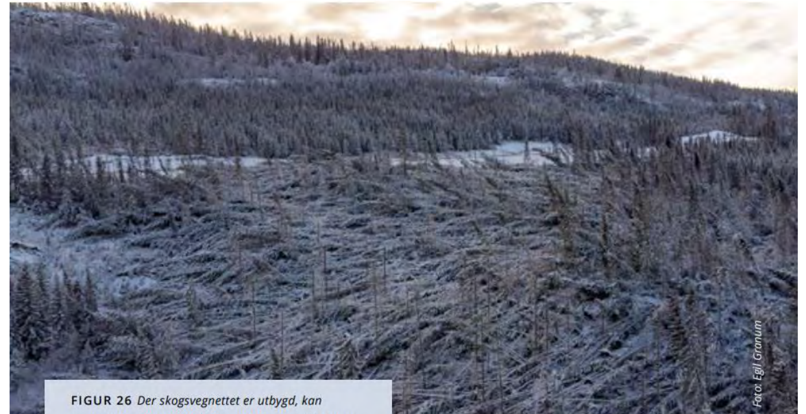
FIGUR 26 Der skogsvegnettet er utbygd, kan opprydding etter stormfellingene komme raskt i gang.