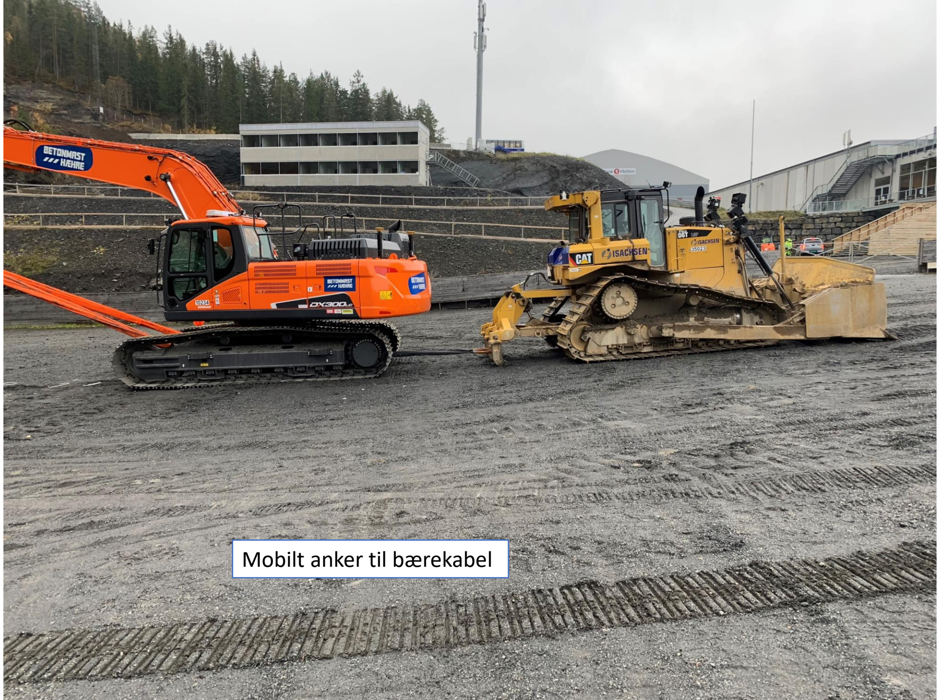
Mobilt anker til bærekabel