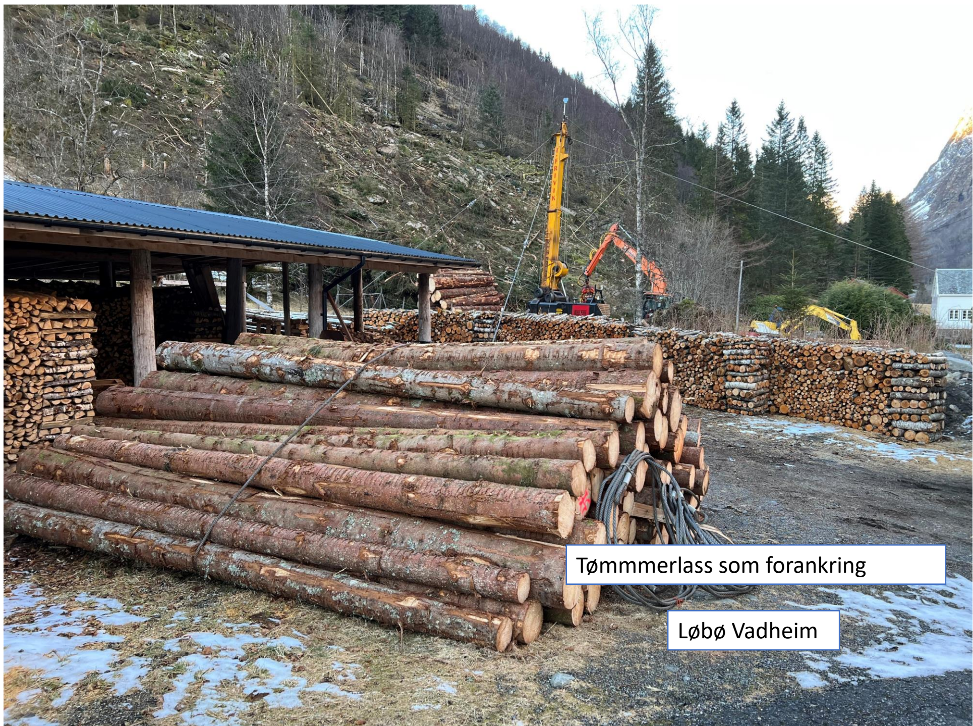
Tømmmerlass som forankring