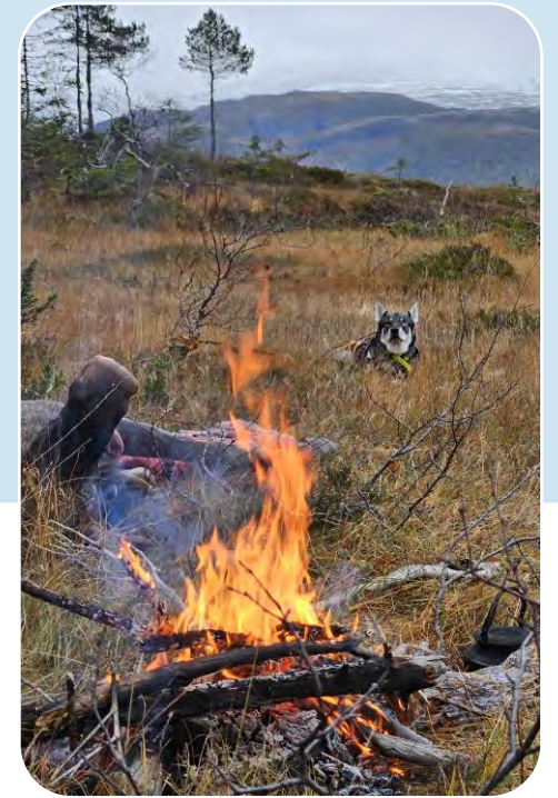
Hjortevilt som næring