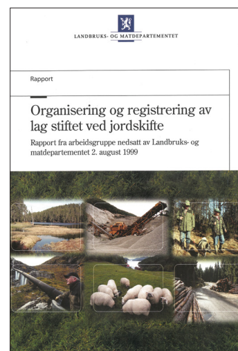
Rapport fra Landbruks- og matdepartementet

Brukere som ikke regnes som sameiere av en vei, kan allikevel ha bruksrett. Jordskifteretten kan lage regler for disse brukerne, som f.eks. forventninger til bidrag til vedlikehold. Det kalles en bruksordning .