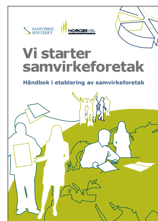
Håndbok i etablering av samvirkeforetak.

Sammenslutningen samvirkeforetak har som hovedformål å fremme medlemmenes økonomiske interesser gjennom deres deltakelse i virksomheten (samhandlingskriteriet og samvirkeformålet), jf. samvirkeloven § 1 (2).